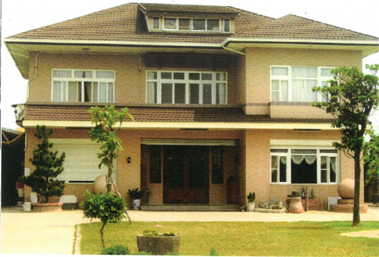
後厝里菩因禪寺的建築主體